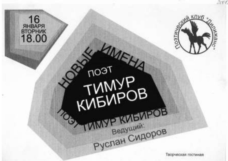
Афиша вечера «Поэт Тимур Кибиров». 16 января 2007 г.