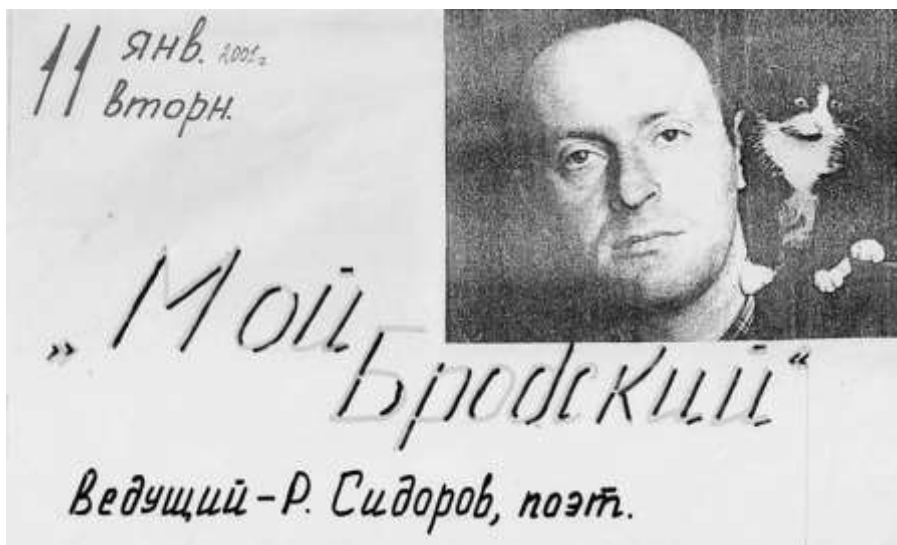
Афиша вечера «Мой Бродский» 11 января 2001 г.