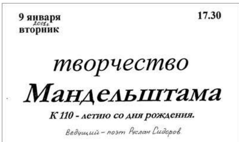
Афиша вечера «Творчество Мандельштама». 9 января 2001 г.

пронзительностью, какой-то обнажённой искренностью, – так Руслан прокомментировал это стихотворение. Он прочитал его на вечере, посвящённом творчеству О.М. Мандельштама.